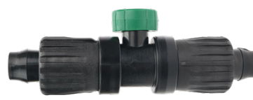
TL-BV Tri-Loc Acoplamiento con válvula de bola