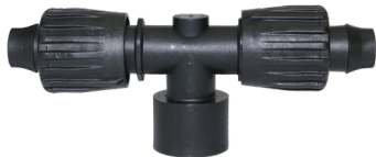
TL-T-S50 Tri-Loc ½" Te manguito