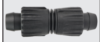
TL-C-HDR Acoplamiento de 20 mm x 20 mm DE