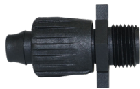
TL-M75 Adaptador Tri-Loc ¾" MPT