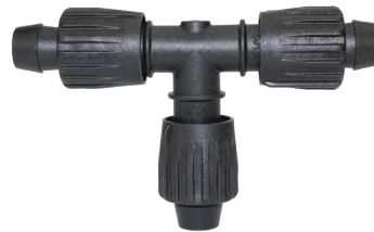
TL-T Te Tri-Loc