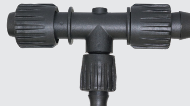
TL-T-HDR La te con reductor de Tri-Loc conecta manguera de goteo de 16 mm, 17 mm y 18 mm (0.63", 0.67" y 0.71") DE a la manguera Toro® T-EHD2057 con DI de 0.805 (20 mm). El acoplamiento TL-T-HDR también funciona con manguera de 0.790" – 0.845" DI (20 mm – 21.5 mm)