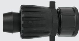
TL-CAP-HDR Manguera de 20 mm DE x tapa MHT