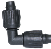
TL-E Codo Tri-Loc