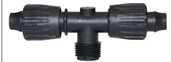
TL-T-M50 Te Tri-Loc ½" MPT