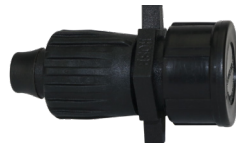
TL-CAP Tri-Loc Tapa MHT