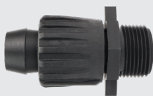
TL-M75-HDR Manguera de 20 mm DE x adaptador ¾" MPT